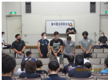
指導者養成研修会