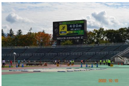
陸上競技大会(NDスタジアム山形)

陸上及び卓球の全国大会を開催し、陸上競技大会10月15日～16日NDスタジアム山形(山形県)、卓球大会11月4日～6日高松市総合体育館(香川県)の日程及び会場にて実施した。