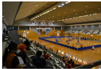
試合風景(維新大晃アリーナ)